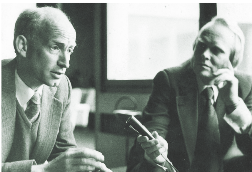
1977. aasta septembris peeti Tallinnas sümposium teemal „Universumi makrostruktuur“. Siia kogunes üle 160 maailma ehituse uurija 19 maalt. Üks nendest oli Cambridge'i astronoomia instituudi direktor Donald Lynden-Bell (vasakul), keda intervjueris Rein Veskimäe.