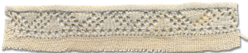
Randsikse pooleratta (umbes sada aastad vana) (Hls)