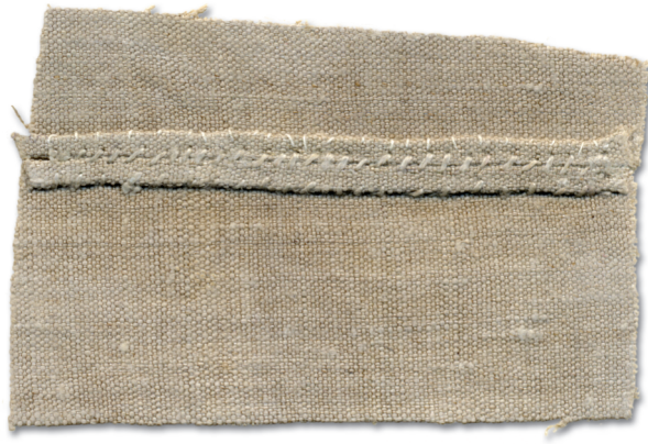
Amme ja rüvvi käüse_otsa õmlus. Rõõvas umbes viiskümmet aastat tagasi tett, kodun koet ja kedrät (Hls)