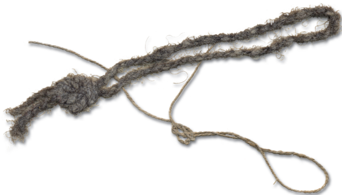
Obese_ännä sõl'm (Hls)