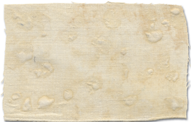
Pääräti palist (seidsekümmet aastad vana) (Hls)