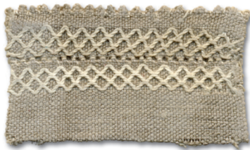
Mešte amme kaaltuke, ristikideg (Hls)