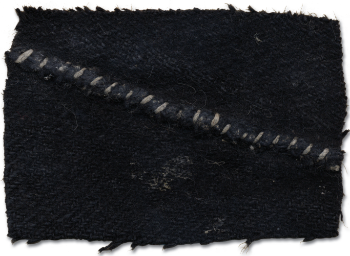
Vammuse tük'k üten siilu õmlusege. Kodun kaarit ja kedrät villest. Umbes sada aastad vana ja käsitsi maaniidig õmmelt. Vammuse nüüj'