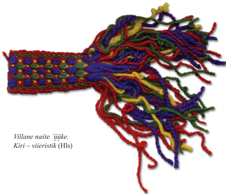
Villane naiste `üüke. Kiri – viieristik (Hls)