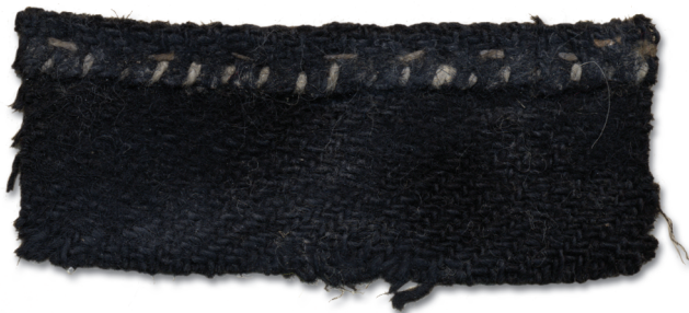
Õlma palist, sellesamma vammuse kül'lest (HIs)