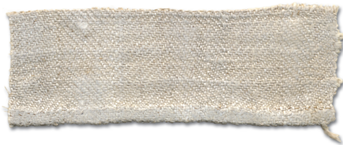
Kodun kedrät lõngast käterät`'t (viiskümment `aastad vana) (Hls)