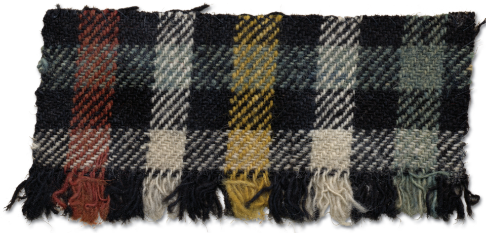
Viielõngaline tek'k kodun kaarit `villest. Kodun kedrät ja kaarit `umbes sada `aastad tagasi, kodu `värmege värmit (Hls)