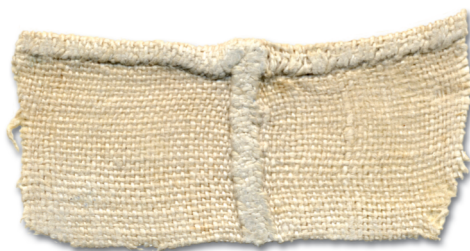
Käüse kokku_õmlemine ja palist. (Tüki võet vana_õigse rüüvi küllest.) (Hls)